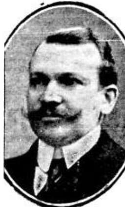
— dl Fr. Sachiiti —